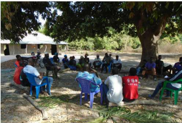
Elegidos los representantes de la comunidad para formar la CASH