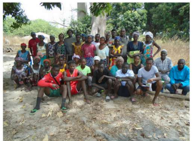
Curso de formación al CASH sobre salud e higiene básica, prevención de enfermedades de transmisión hídrica y del COVID 19.