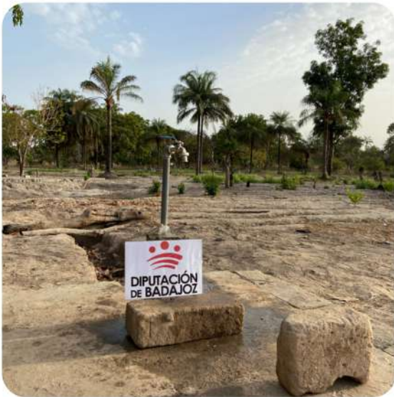
Montaje del sistema de elevación de agua y fuente de punto de recogida.