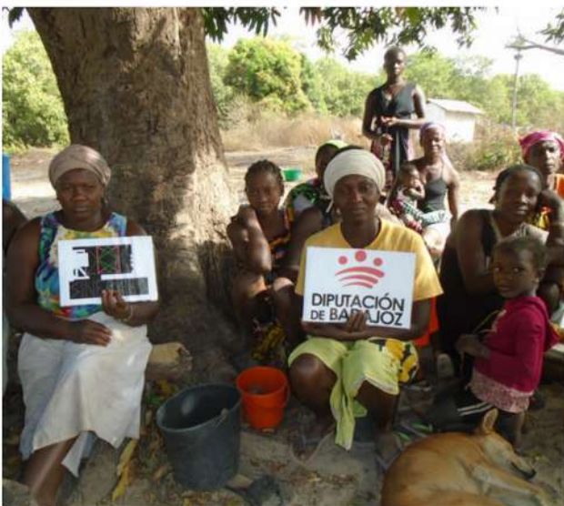
Curso de formación sobre mantenimiento y gestión sostenible y segura del agua y las infraestructuras de agua