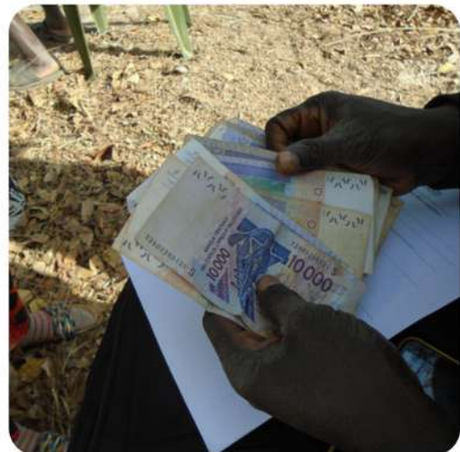
Curso de formación sobre gestión de fondos y plan económico para el mantenimiento y sostenibilidad de las infraestructuras